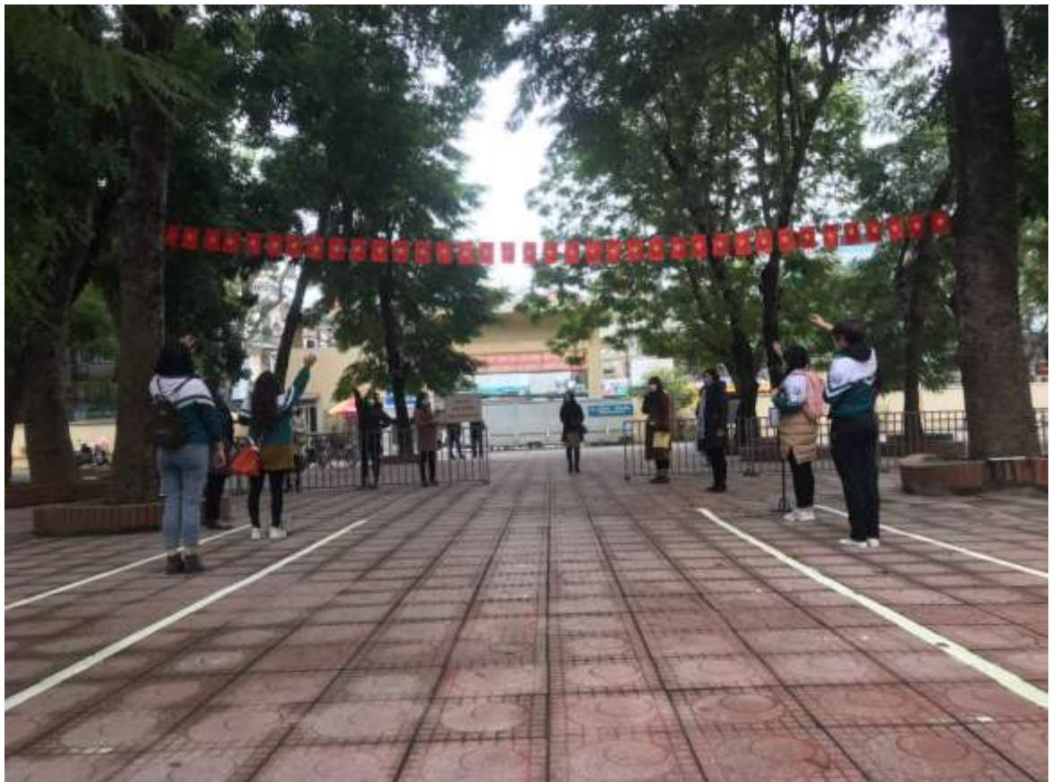
Học sinh xếp hàng theo lối đi về đúng khoảng cách.