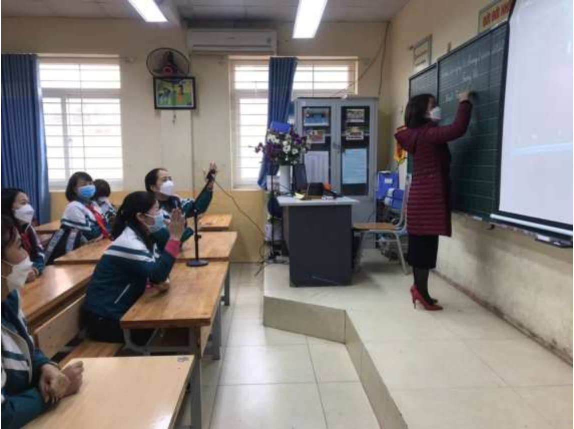
Giáo viên tham gia tập huấn dạy trực tiếp kết hợp trực tuyến.