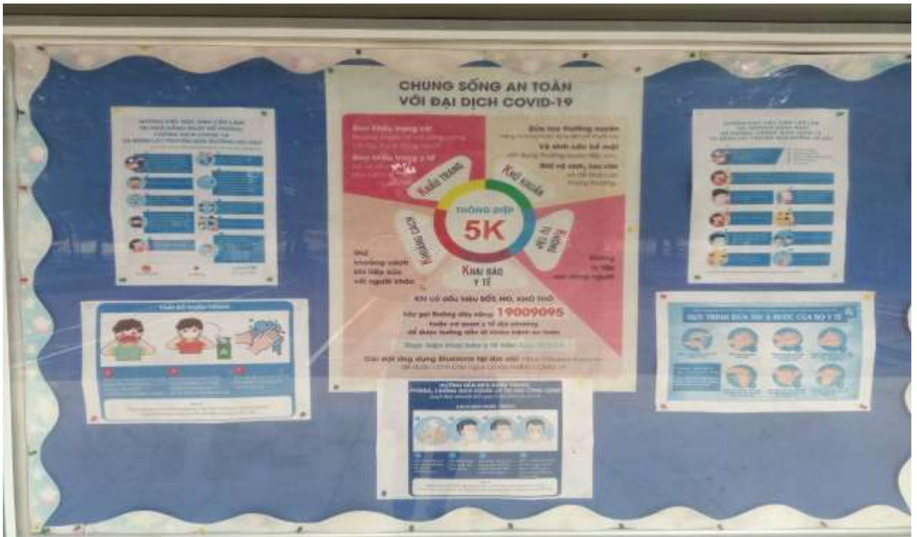
Nhà trường đã gắn sổ tay đảm bảo an toàn phòng, chống Covid-19 trong các lớp học, trên bảng thông tin của nhà trường để học sinh nắm bắt các thông tin cần thực hiện hàng ngày trong trường.