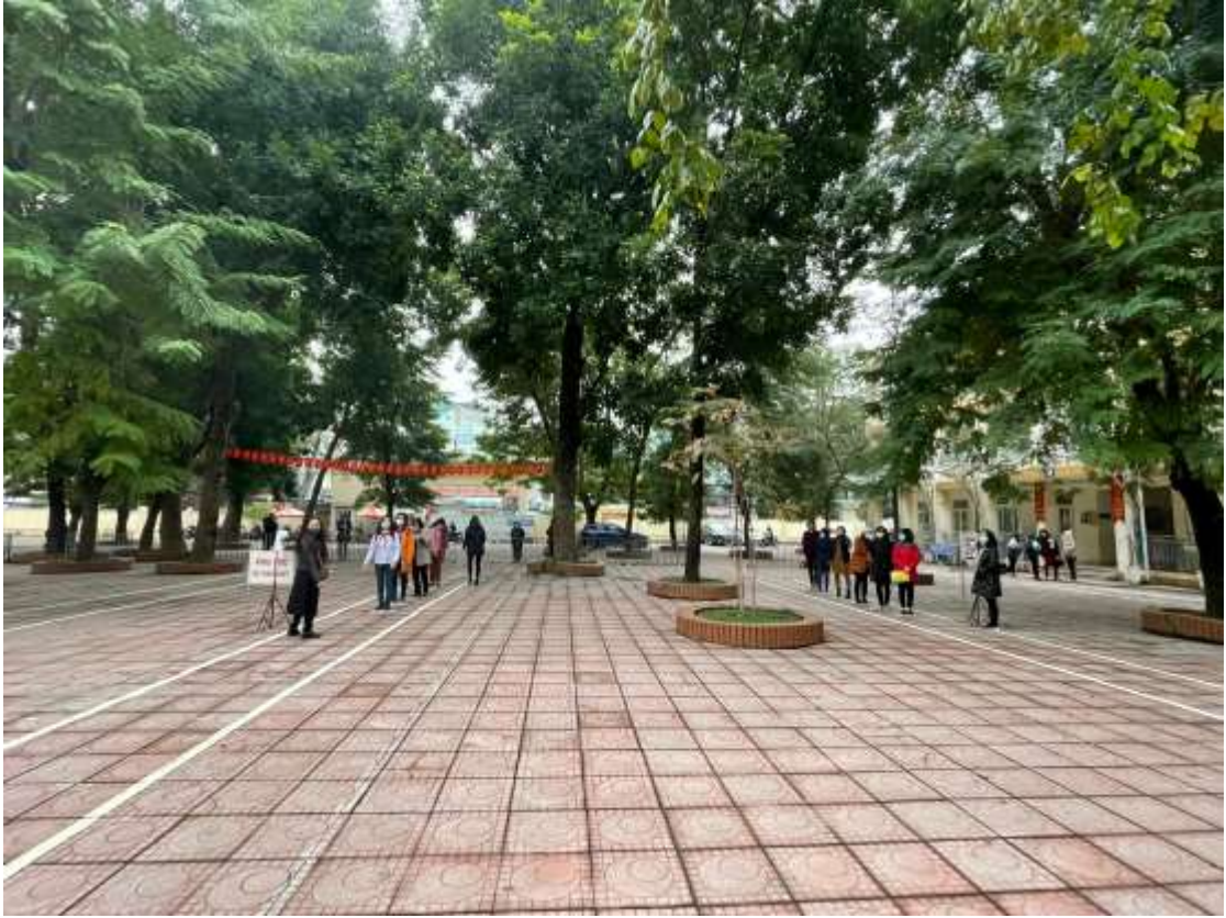
Học sinh xếp hàng theo luồng đã quy định theo các khu nhà.