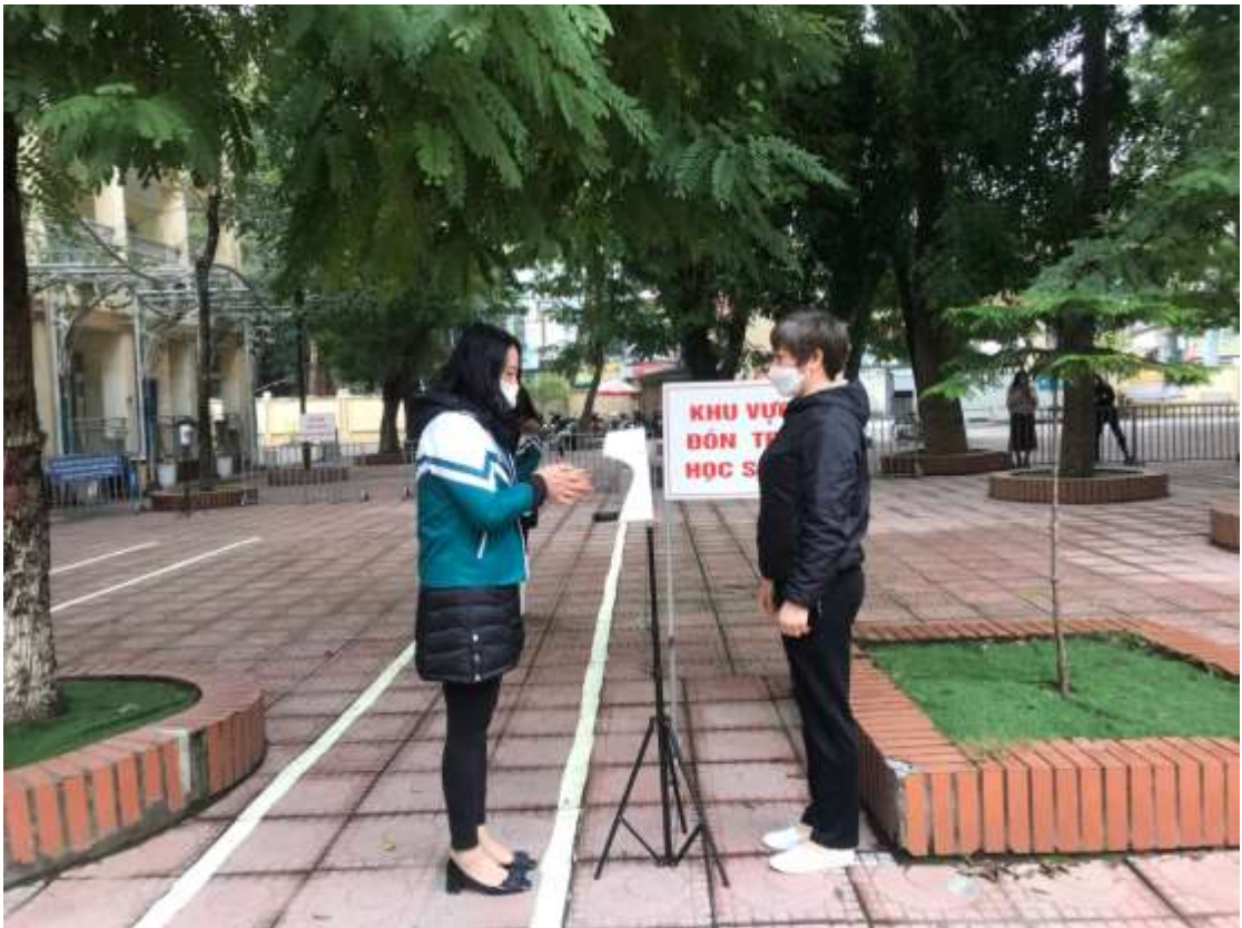
Học sinh sát khuẩn tay trước khi vào lớp.