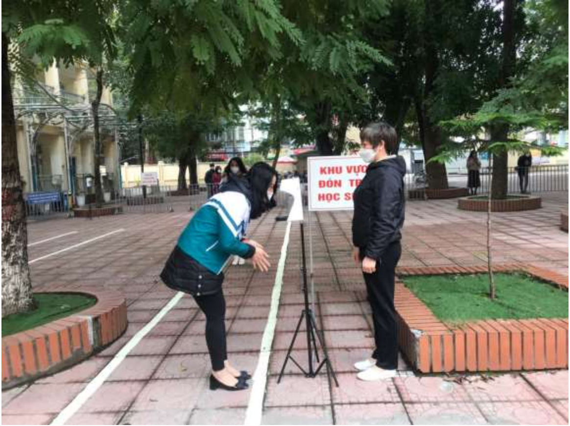
Học sinh xếp hàng đứng khoảng cách đo nhiệt độ trước khi vào lớp.