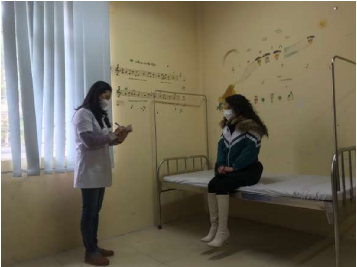
Cán bộ y tế xử trí khi có trường hợp nghi ngờ mắc Covid-19