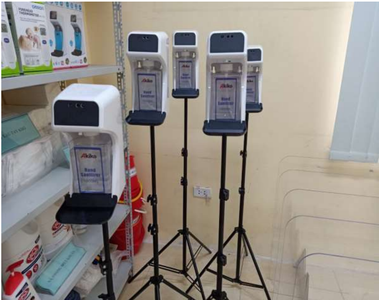
Nhà trường đã chuẩn bị máy đo nhiệt độ và rửa tay tự động khi học sinh đến trường.