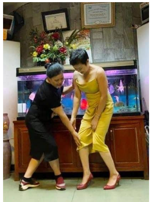
Chị Hương say sưa và tận tình với các học sinh của mình