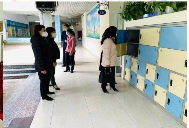
Trường được đoàn kiểm tra của quận đánh giá cao về cơ sở vật chất, khung cảnh sư phạm