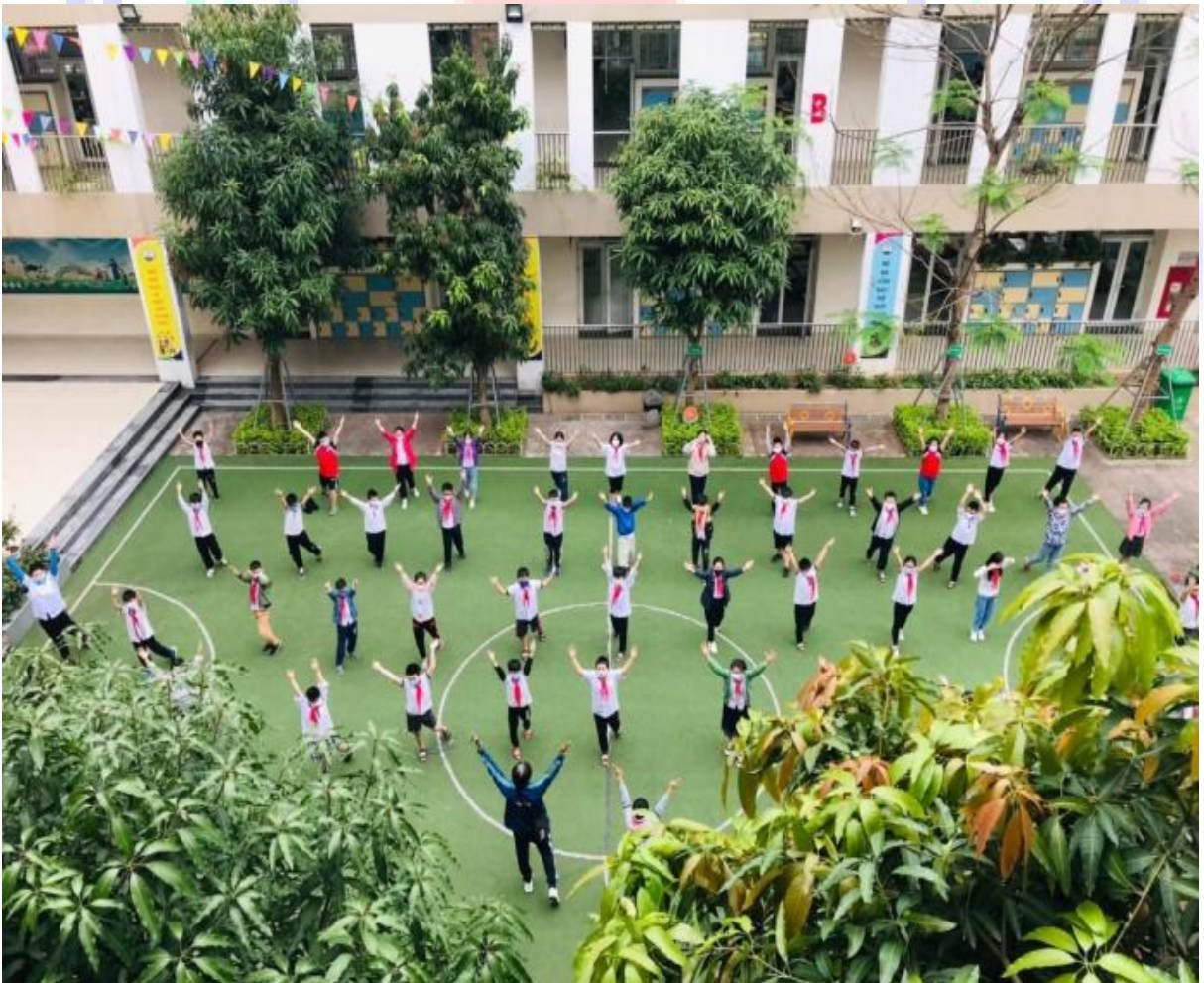
Giờ học thể dục trong những ngày đầu tiên quay trở lại trường học tập trực tiếp