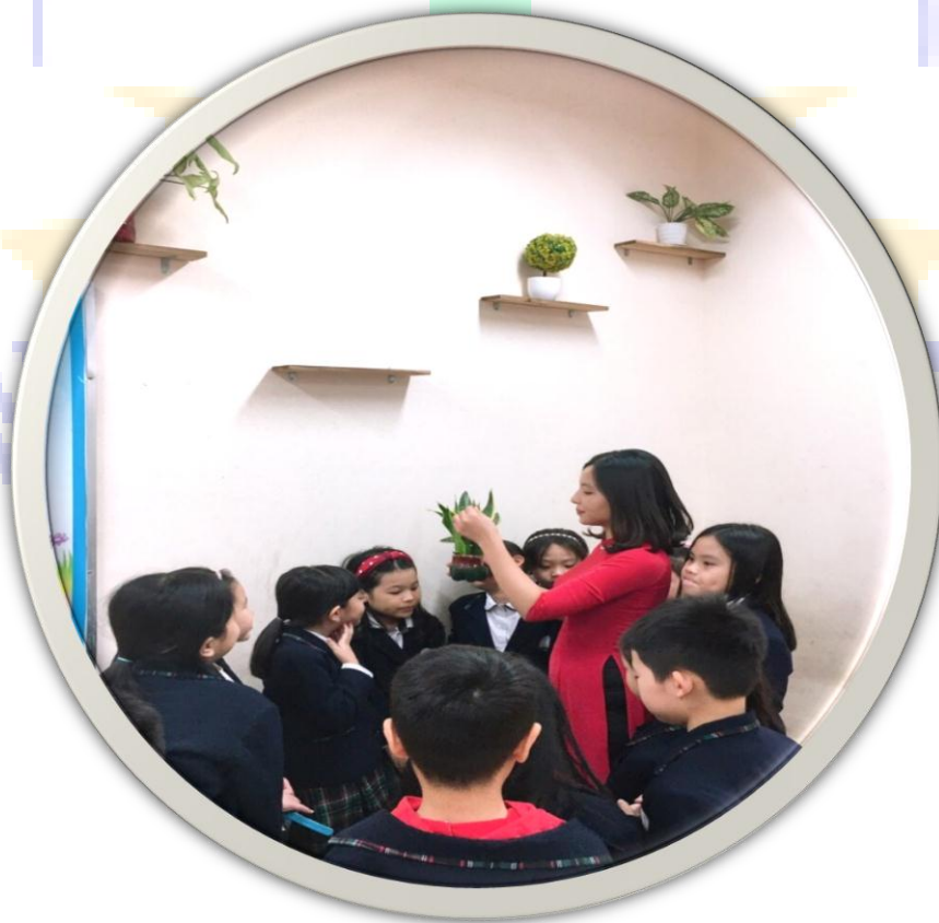
Cô giáo cùng học sinh lớp 3A6 trang trí lớp học.

Ban giám hiệu lên kế hoạch phát động phong trào Lớp học Xanh- Sạch- Đẹp. Cho một lớp triển khai mẫu và nhân rộng mô hình ra toàn trường. Phong trào được đông đảo giáo viên, học sinh và phụ huynh hưởng ứng. Một trường học, lớp học xanh mát, ngập tràn sắc màu thiên nhiên, để mỗi ngày đến lớp, các em học sinh có cảm giác như mình đang vào công viên. Quả là tâm trạng tuyệt vời. Nhìn ở phương diện khoa học: cây cỏ, lá hoa được ví như lá phổi thanh lọc những khí chất độc hại cho cơ thể. Ở góc độ đời sống tinh thần, màu xanh thiên nhiên có tác dụng giúp tâm hồn thư giãn, sáng khoái. Để thực hiện phong trào trên, nhà trường giao cho mỗi lớp phụ trách trang trí lớp học xanh cho chính lớp mình.