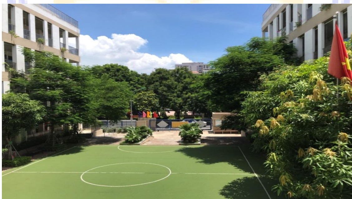
Góc nhìn từ sân khấu là một khoảng trời xanh mát

Phong trào đã giúp cho hệ thống cây xanh của nhà trường luôn được bảo vệ, chăm sóc xanh tốt. Tạo nên khuôn viên nhà trường mát mẻ, sáng khoái. Trường học đã thật sự gần gũi thân thiện với giáo viên, học sinh và tất cả mọi người khi đến trường. Giáo viên, bảo vệ và học sinh đều nêu cao tinh thần trách nhiệm về việc làm cho trường xanh, sạch, đẹp