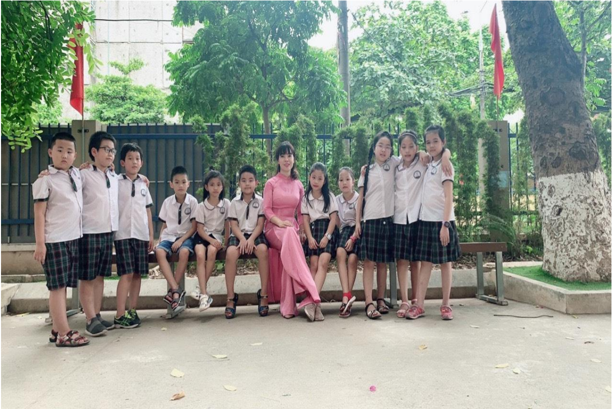
Hàng trúc xinh trở thành nơi lưu giữ kỷ niệm đẹp của cô và trò trường TH Thanh Xuân Bắc