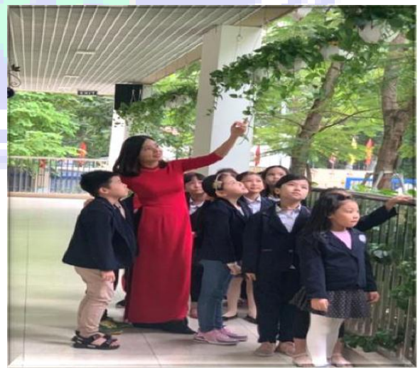
Hành lang rộng bóng mát