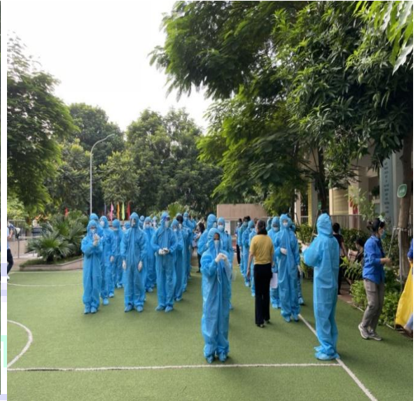
Trường học Xanh- Sạch- Đẹp trở thành địa chỉ tiêm chủng phòng chống COVID-19 an toàn