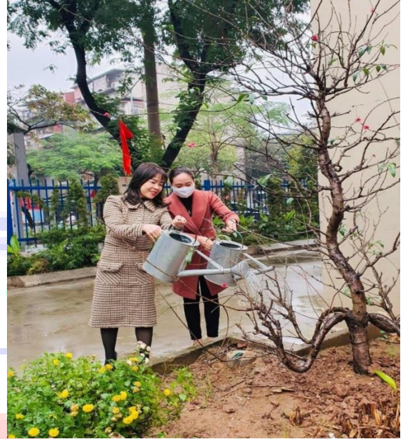
Ban giám hiệu, giáo viên và nhân viên cùng tham gia chăm sóc cây xanh