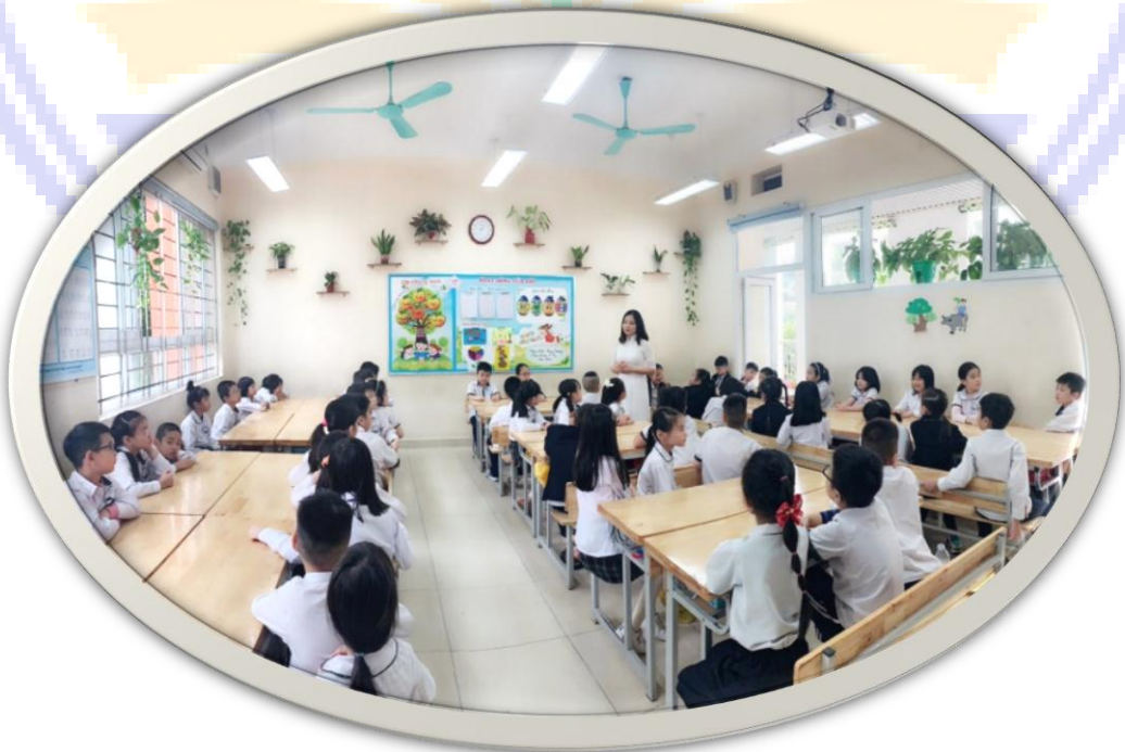
Hình ảnh lớp học Xanh- Sạch- Đẹp