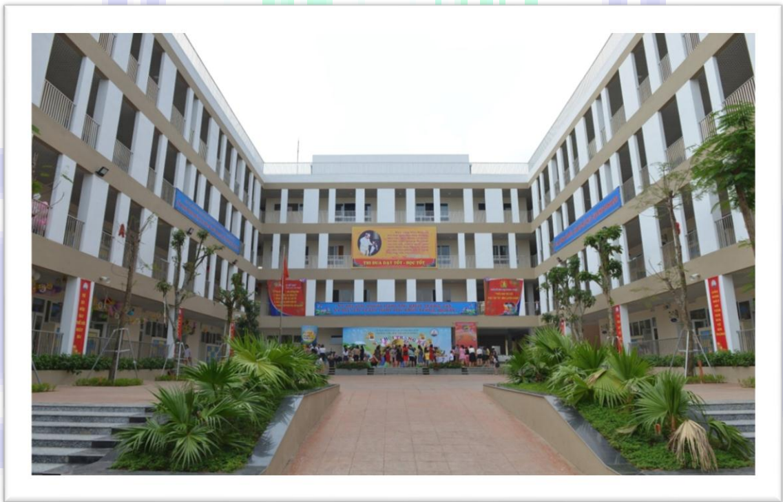
Trường TH Thanh Xuân Bắc năm học 2018- 2019

Đội ngũ cán bộ, giáo viên và nhân viên của trường hiện tại có 49 đồng chí, luôn có tinh thần khiêm tốn học hỏi lẫn nhau, giúp đỡ nhau trong mọi hoàn cảnh và nỗ lực phấn đấu trên mọi phương diện. Trường TH Thanh Xuân Bắc là một trong những ngôi trường có đội ngũ giáo viên trẻ, năng động, tâm huyết với nghề nghiệp, nhiều năm liền trường đạt danh hiệu Tập thể lao động Tiên tiến. Học sinh của trường không những nhiều em đạt học sinh giỏi ở cấp Quận, cấp Thành phố, có em còn đạt giải Quốc gia trong các cuộc thi cho thiếu niên, nhi đồng.