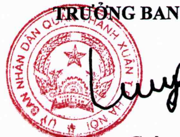
Lê Trung Cường PHÓ CHỦ TỊCH UBND QUẬN