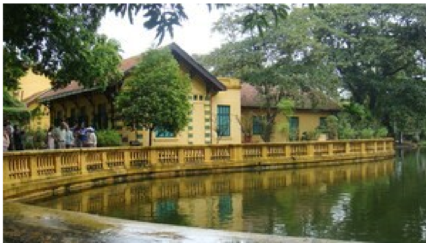
Nhà 54 trong khu di tích Chủ tịch Hồ Chí Minh tại Phủ Chủ tịch

Hà Nội mùa thu tiết trời hơi se lạnh, hoa sữa nở trên nhiều tuyến phố. Vào thời điểm này cách đây 70 năm, ngày 10/10/1954, thủ đô Hà Nội đang hân hoan