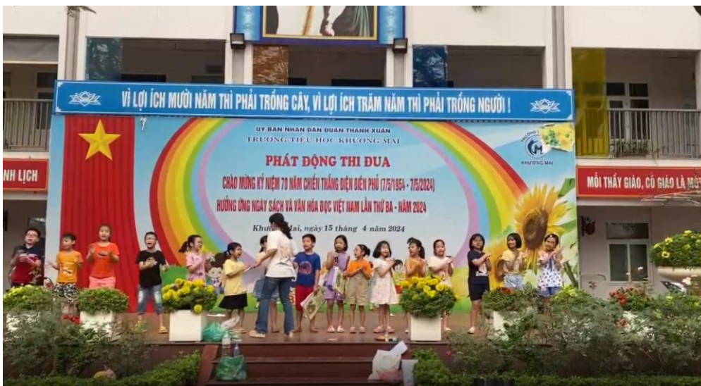
Không chỉ thể hiện qua những lời kể, các bạn học sinh còn đưa vào tiết mục những câu vè, những lời hát xẩm, những tiếng rao...