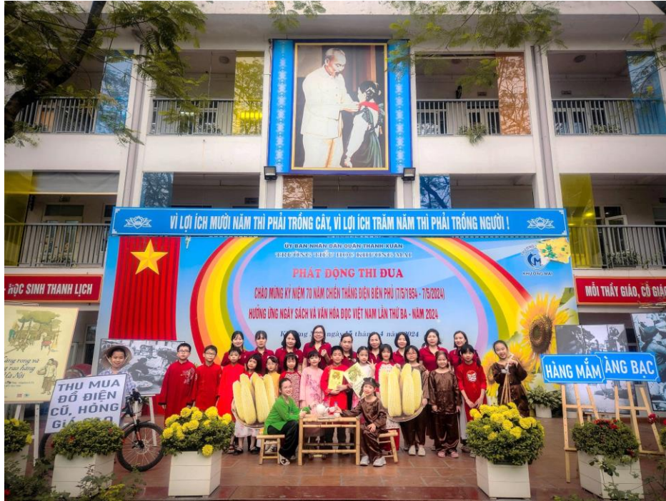
Các bạn học sinh lớp 3I cùng các cô trong Ban giám hiệu và các cô Khối 3