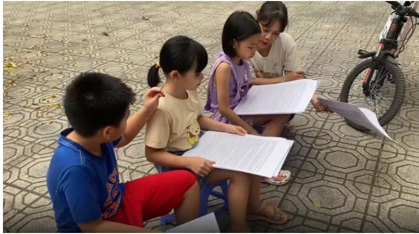
Cô Thủy cùng 3 bạn dẫn chuyện hăng say tập luyện kịch bản