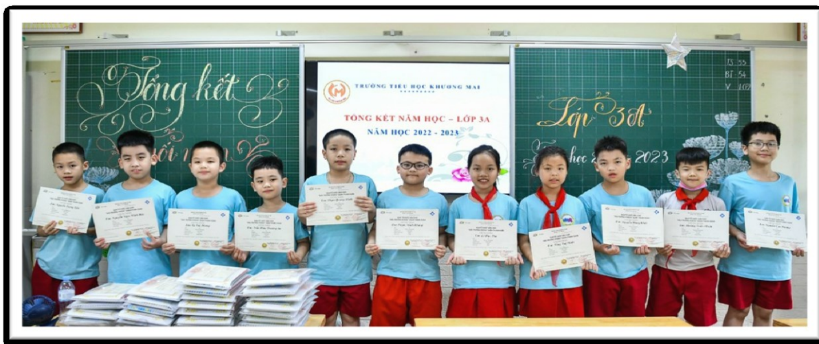
Hình ảnh HS lớp 3A đoạt giải trong sân chơi Đấu trường Vioedu cấp Quận

Với gần 30 năm đứng lớp, trình độ chuyên môn vững vàng nhưng chị vẫn không ngừng học hỏi, luôn cảm thấy không bao giờ thoả mãn với chính mình. Những tiết chuyên đề, hội giảng của đồng nghiệp trong trường chị đều sắp xếp thời gian đi dự. Chịu khó học hỏi từ đồng nghiệp cùng với sự nhiệt huyết say mê chuyên môn, chị luôn đi đầu trong việc đổi mới phương pháp và ứng dụng công nghệ thông tin vào bài dạy. Mỗi bài giảng của chị đều mang đến những điều mới lạ, hấp dẫn làm cho học sinh yêu thích việc học. Dự giờ các tiết chuyên đề, hội giảng của chị, tôi học tập được phong cách dạy tự nhiên, sự sáng tạo trong cách tổ chức các hoạt động, khả năng hoạt náo làm tiết học trở nên vui nhộn, nhẹ