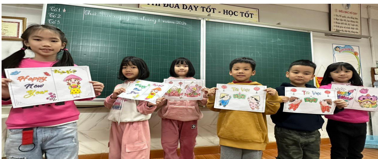
Học sinh lớp 1A vẽ tranh tặng các bệnh nhi ung thư

Khi nhận được thông báo phát động chương trình thiện nguyện đầy ý nghĩa này, giáo viên chủ nhiệm của các lớp khối 1 đã nhanh chóng triển khai đến học sinh lớp mình. Các cô đã động viên, hướng dẫn các con hoàn thành những bức tranh đầy màu sắc cùng những lời chan chứa yêu thương – món quà trao tặng các bệnh nhi tại viện K.