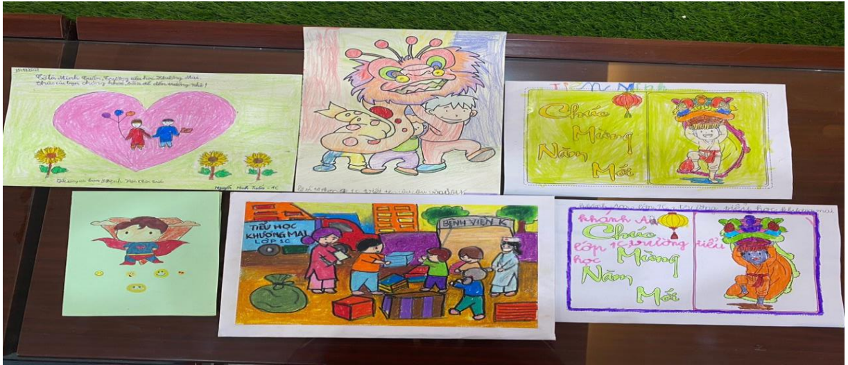
Học sinh lớp 1C vẽ tranh tặng các bệnh nhi ung thư