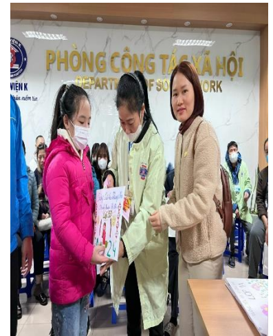
Các cô giáo khối 1 trao quà tết cho bệnh nhi ung thư

Với tấm lòng sẻ chia và tinh thần tương thân tương ái, trường tiểu học Khương Mai nói chung và cô trò khối 1 nói riêng hi vọng các bệnh nhi ở đây có thêm niềm tin và sức mạnh để chiến thắng bệnh tật, sớm bình phục để trở về đoàn tụ với gia đình trong những ngày Tết Nguyên đán.