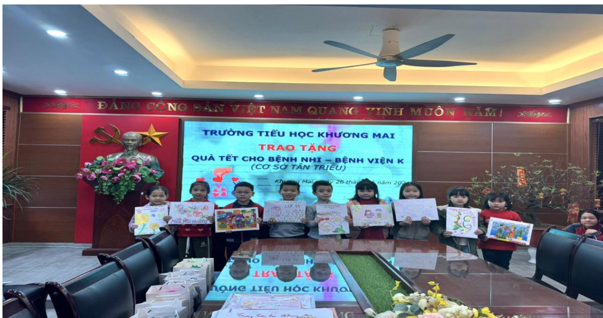
Đại diện học sinh của các lớp khối 1 trao tặng quà tết cho các bệnh nhi

“Thương người như thể thương thân” là truyền thống quý báu của dân tộc Việt Nam từ ngàn đời. Trong những ngày cận kề Tết Giáp Thìn, trường Tiểu học Khương Mai đã tổ chức chương trình thiện nguyện tại bệnh viện K Tân Triều với mục đích lan tỏa tình yêu thương và trao tặng quà tết cho bệnh nhi ung thư. Cô và trò khối 1 cũng có những món quà là những bức tranh và lời chúc gửi gắm đến các bạn nhỏ đang ngày đêm chống chọi với bệnh tật.