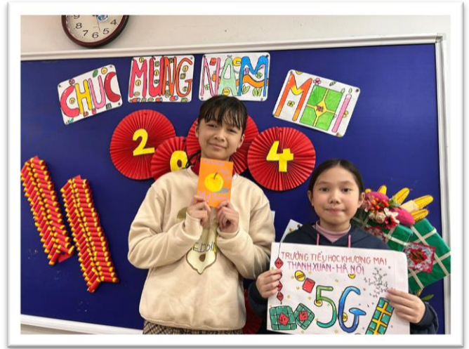
Nghĩa cử truyền thống