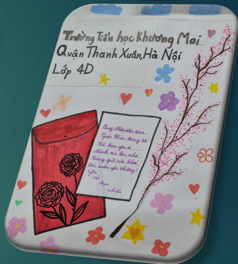
Những lá thư trao gửi yêu thương đến các bạn nhỏ ở bệnh viện K (Tân Triều)