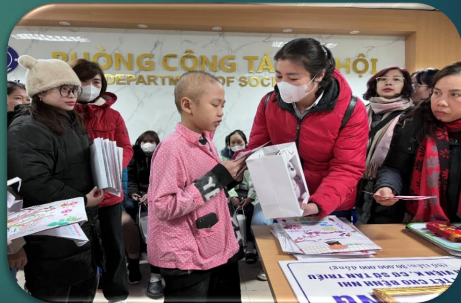
Đại diện BGH, CBGV, CMHS và HS Trường Tiểu học Khương Mai tặng quà cho các bạn nhỏ đang điều trị tại bệnh viện K (Tân Triều)