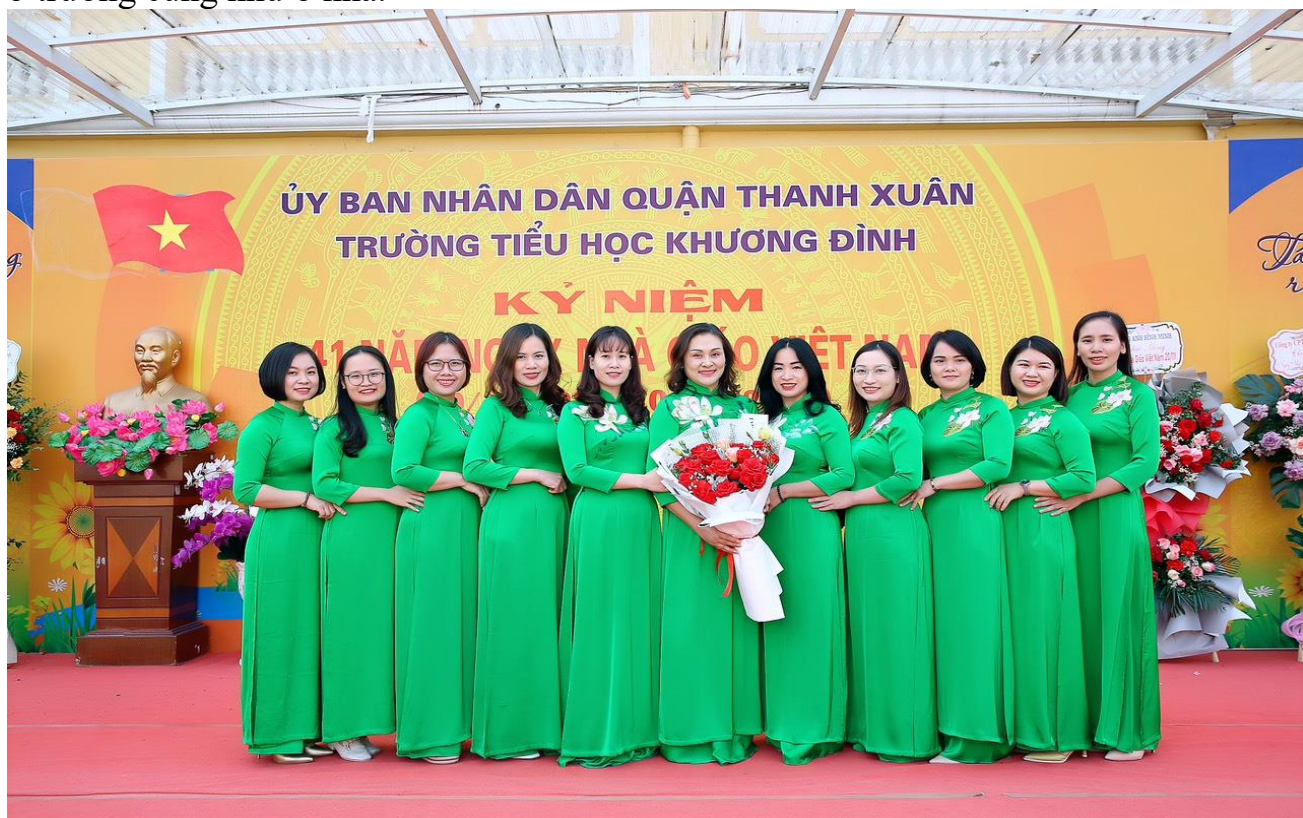
Các cô giáo khối 2 cùng Ban giám Hiệu nhà trường

đồng nghiệp, cùng vui, cùng trò chuyện và chia sẻ kinh nghiệm trong cuộc sống. Luôn động viên tinh thần cho các đồng nghiệp trong Nhà trường để hoàn thành tốt nhiệm vụ ở trường cũng như ở nhà.