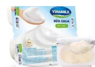
TM: Sữa chua