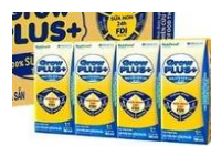
Sữa Grow kid