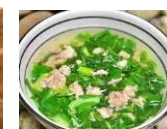
Canh rau cải nấu thịt lợn