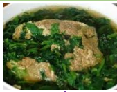
Canh mồng tơi nấu cua đồng