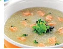
Cháo cá hồi