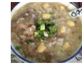
Cháo chim bồ câu đậu xanh hạt sen