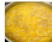
Cháo bò lợn bí đỏ