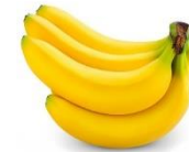
TM: Chuối tiêu