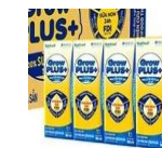
Sữa Grow kid