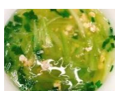
Canh bí xanh nấu thịt lợn