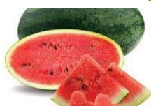
TM: Dưa hấu