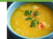
Cháo tôm thịt lợn bí đỏ