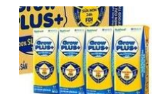
Sữa Grow kid