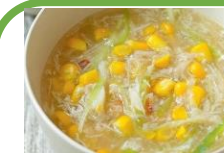
Súp gà ngô kem