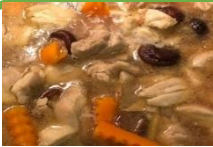
Cơm thịt gà lợn om nấm