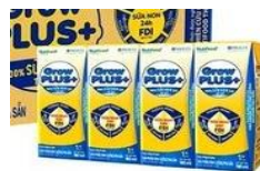
Sữa Grow kid