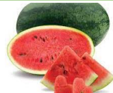
TM: Dưa hấu