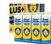
Sữa Grow kid