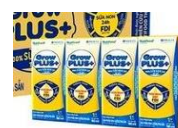
Sữa Grow kid