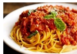
Mỳ ý sốt Spaghetti