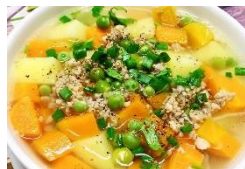
Canh khoai tây cà rốt nấu thịt lợn