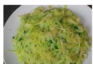
Bắp cải xào