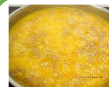
Cháo bò lợn bí đỏ