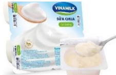
TM: Sữa chua