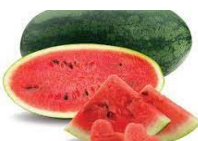
TM: Dưa hấu