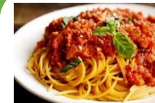
Mỳ ý sốt Spaghetti