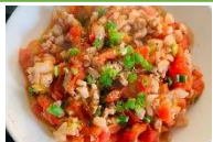
Cơm thịt lợn, cá sốt cà chua