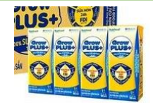
Sữa Grow kid