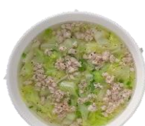
Canh bắp cải nấu thịt