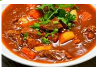
Cơm thịt bò, lợn sốt vang