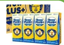
Sữa Grow kid