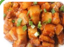
Cơm thịt bò, thịt lợn rim