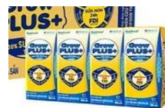
Sữa Grow kid