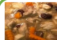
Cơm thịt gà lợn om nấm