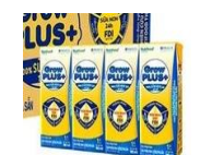
Sữa Grow kid