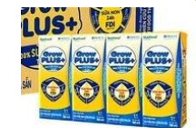
Sữa Grow kid