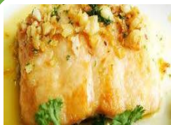
Cơm thịt lợn rim, cá chiên bơ tỏi