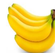
TM: Chuối tiêu