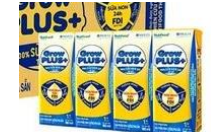
Sữa Grow kid