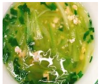
Canh bí xanh nấu thịt