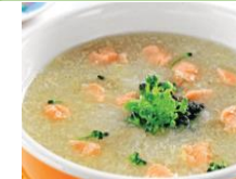
Cháo cá hồi