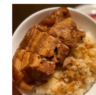
Xôi thịt lợn kho tàu