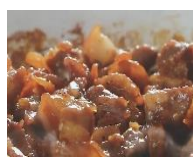
Cơm tôm rim thịt lợn sốt cà chua