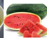
TM: Dưa hấu