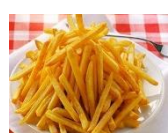
Khoai tây chiên