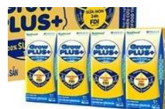
Sữa Grow kid