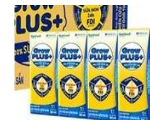
Sữa Grow kid

Thực đơn có thể được điều chỉnh tùy thuộc vào tình hình thực tế nhưng không làm ảnh hưởng đến hàm lượng dinh dưỡng của trẻ