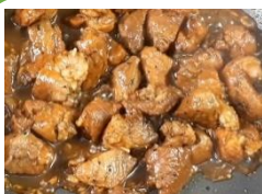
Cơm thịt bò, thịt lợn kho