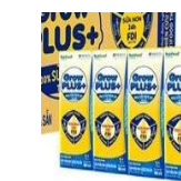
Sữa Grow kid

Thực đơn có thể được điều chỉnh tùy thuộc vào tình hình thực tế nhưng không làm ảnh hưởng đến hàm lượng dinh dưỡng của trẻ