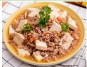
Cơm thịt lợn đậu phụ sốt cà chua