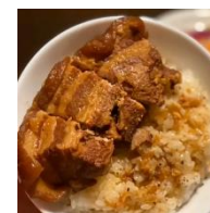
Xôi thịt lợn kho tàu