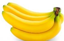
TM: Chuối tiêu