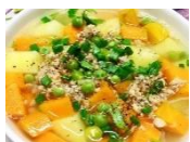
Canh khoai tây cà rốt nấu thịt