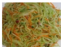
Su su xào cà rốt