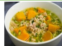
Canh bí đỏ nấu thịt