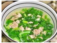
Canh rau cải nấu thịt lợn