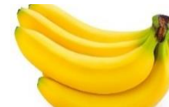
TM: Chuối tiêu