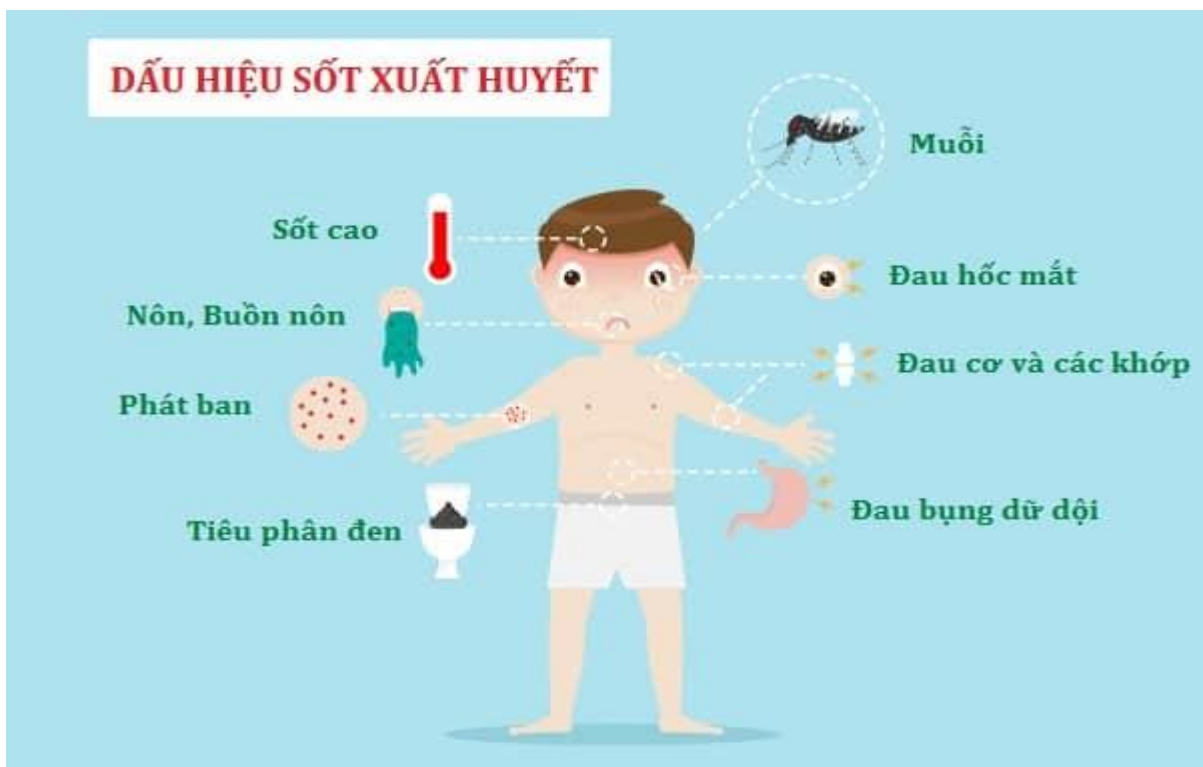
Dấu hiệu sốt xuất huyết