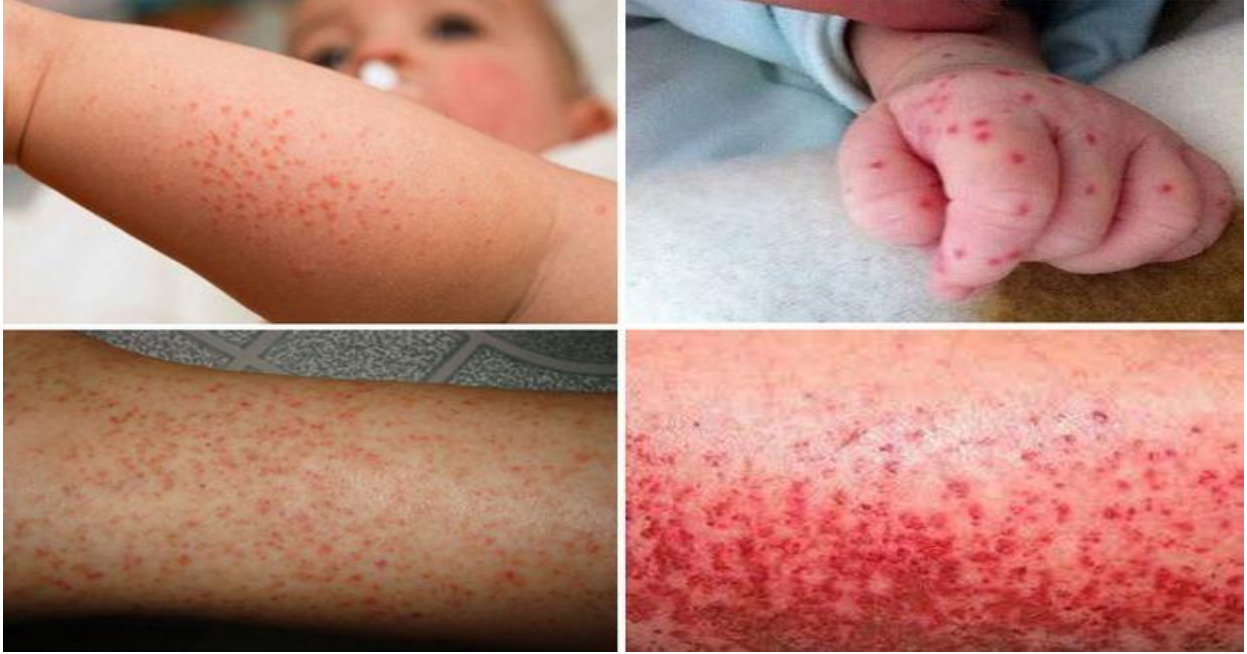
Sốt cao kèm theo dấu hiệu phát ban

+ Thể nhẹ: sốt cao đột ngột trên 38°C, kéo dài trong 2 – 7 ngày, khó hạ sốt, đau đầu dữ dội vùng trán, đau sau nhãn cầu, có thể có dấu hiệu phát ban, không kèm theo ho, sổ mũi.